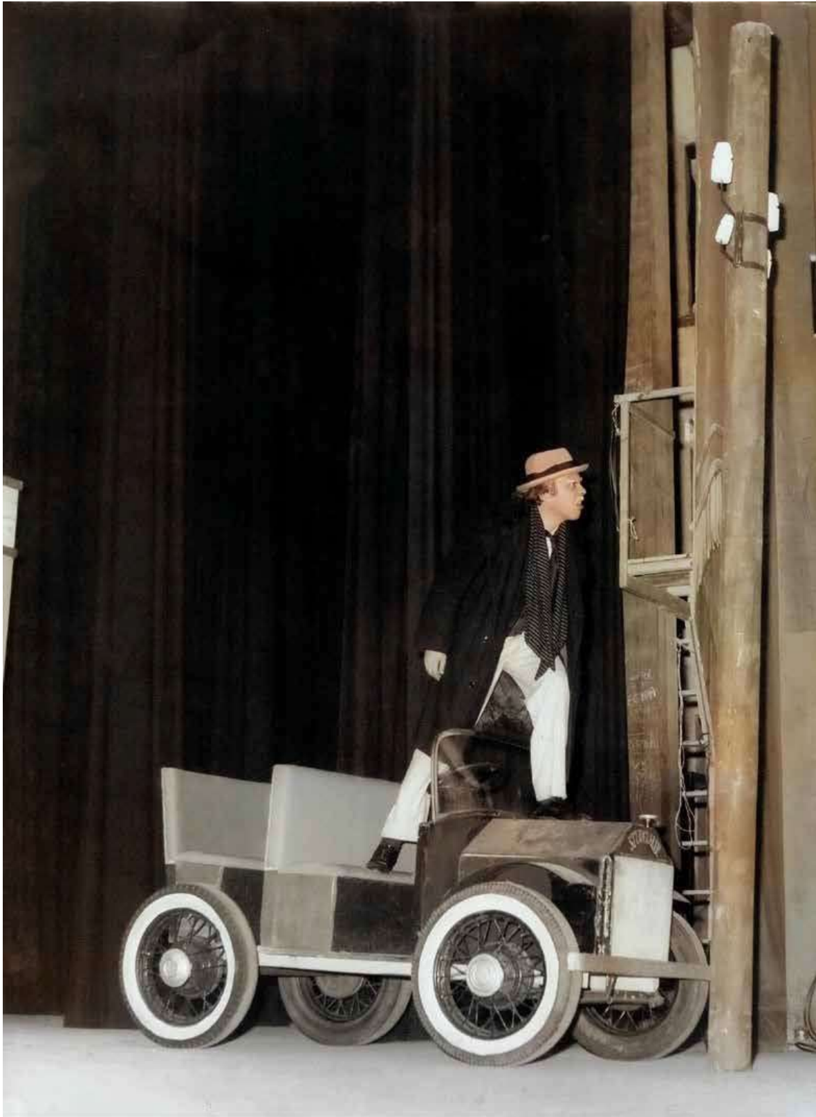
O Senhor Puntila e o seu Criado Matti, 1975