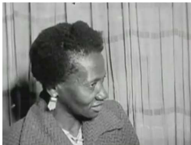
Carolina de Jesus,